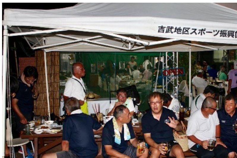
2018 福岡感大会懇親会